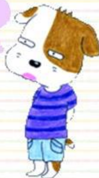
いつもお腹を突き出して 上向き姿勢の 犬介くん