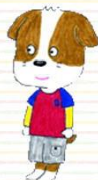
いつも腰が入って 目線が水平な 犬太郎くん