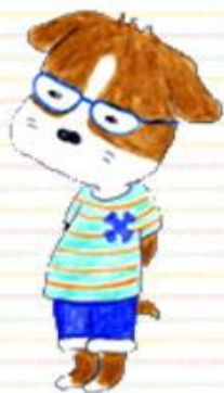
最近めがねを買って もらった犬介クンの兄 犬吉くん